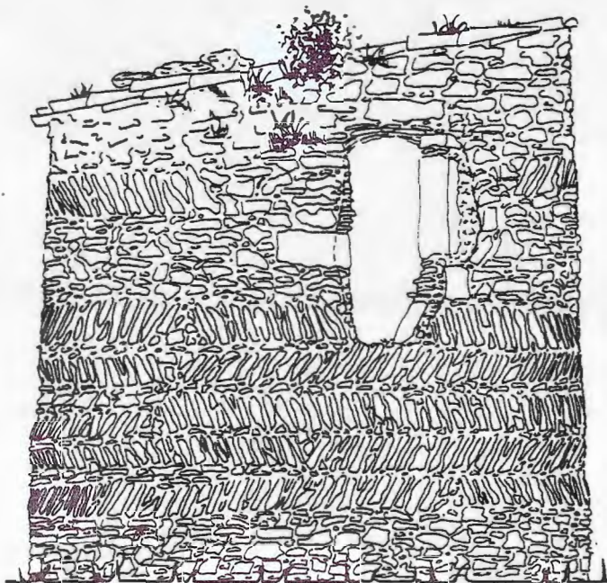
ALÇAT LATERAL DRET