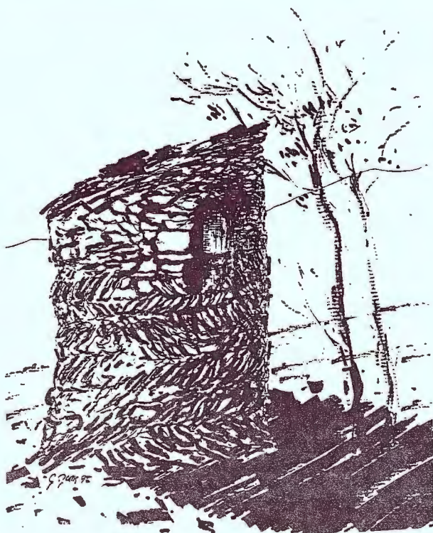
(Dibuix de Guillem Rocas)

Des del s. IX hi ha notícies sobre la cria de tudons o coloms silvestres i sobre l'existència de colomers en terres catalanes, com és ben conegut. S'han conservat, una mica arreu i més o menys sencers, alguns colomers rurals aïllats, medievals o d'èpoques posteriors. Potser són especialment notables alguns de l'Alt Urgell, Andorra, el Pallars Sobirà, el Penedès i la Segarra. En general, són construccions en forma de torre rectangular o quadrada, sempre amb els rengles de nius en els paraments interiors, l'element que els defineix de manera més clara i evident.